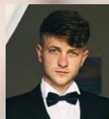
Мирослав Дубинецький (контратенор) Myroslav Doubenetskiy (contreténor)