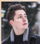
Сергій Гаврилюк (скрипка) Serguiy Havrylyuk (violon)